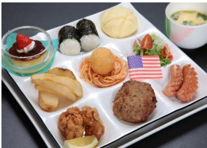
お子様ランチ 1,760円(税込)