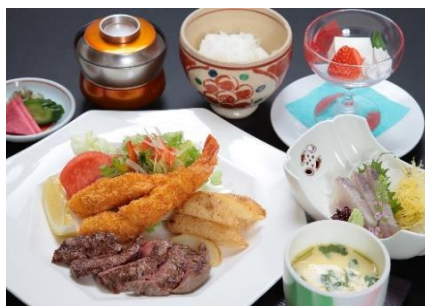
エビフライ&ステーキ定食 3,300円(税込)