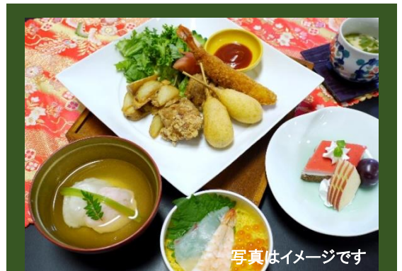
祝い膳 ※3日前までの要予約 2,750円(税込)